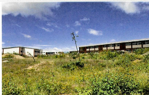
F2- Vista Este - Oeste