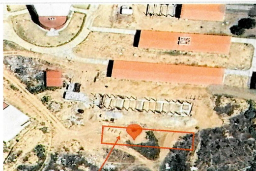
F1- Vista aerea del edificio