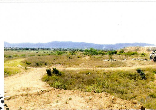
F4- Vista Norte - Sur