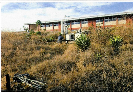
F3- Vista Sur - Norte